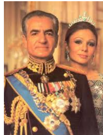
Sha de Irán